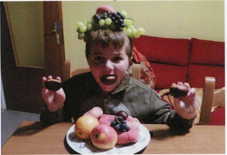
Elia - Che abbondanza ....