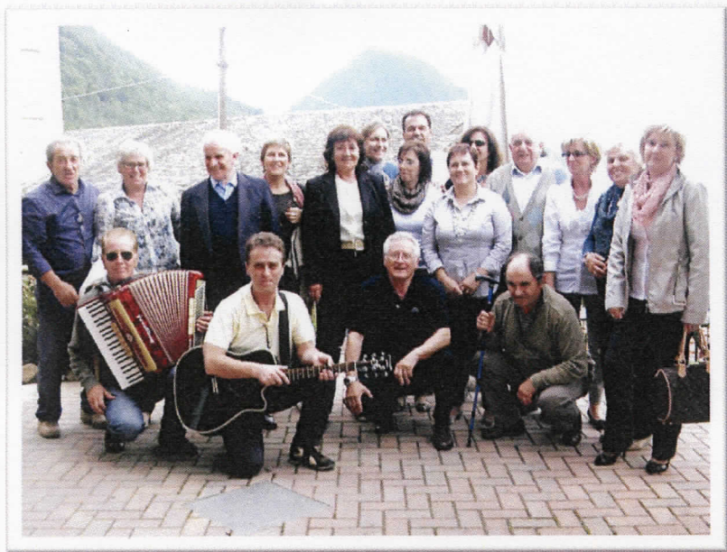
La cantoria in trasferta a Dosso del Liro