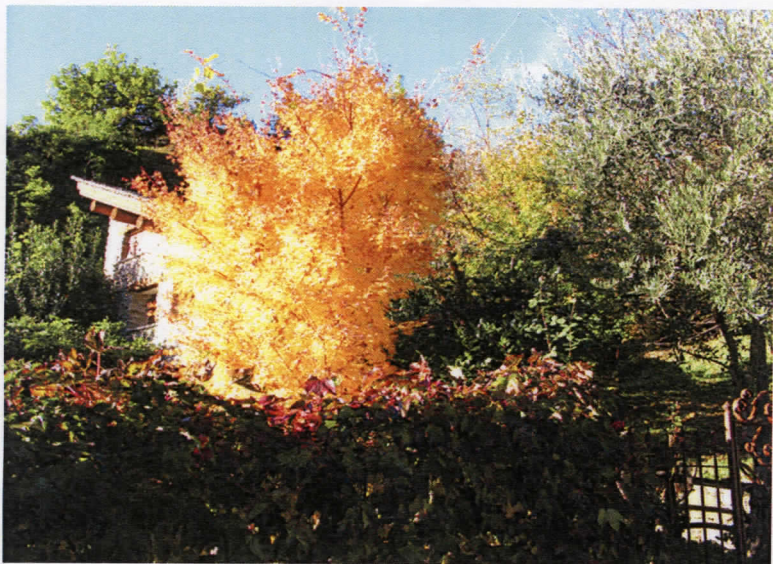
Autunno con i suoi colori