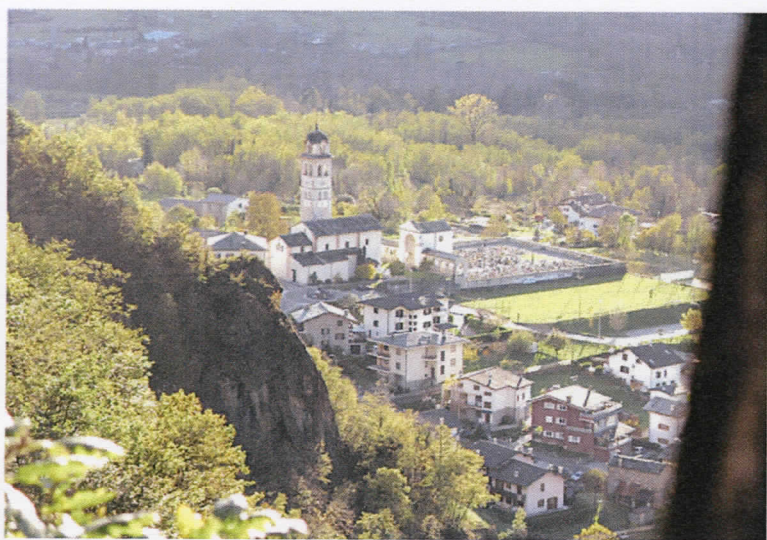
Una visione particolare