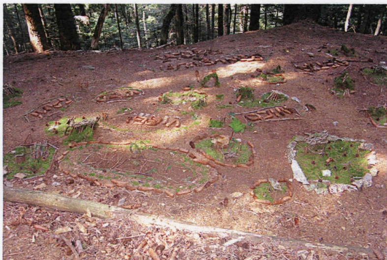
Bambini e ... urbanizzazione del bosco!